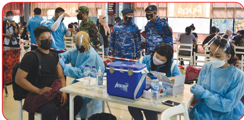
Apindo Kepri dan PSMTI menggandeng Lanud Hang Nadim menggelar Serbuan Vaksin Covid-19.