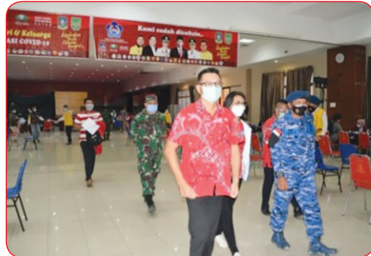
Pimpinan PSMTI Riau mendampingi Danlanud Letkol Pnb Iwan Setiawan meninjau kegiatan Serbuan Vaksin Covid-19 di Resto Pulas Hati.

prajuritnya sebagai unsur pengamanan dan 2 orang sebagai vaksinator.