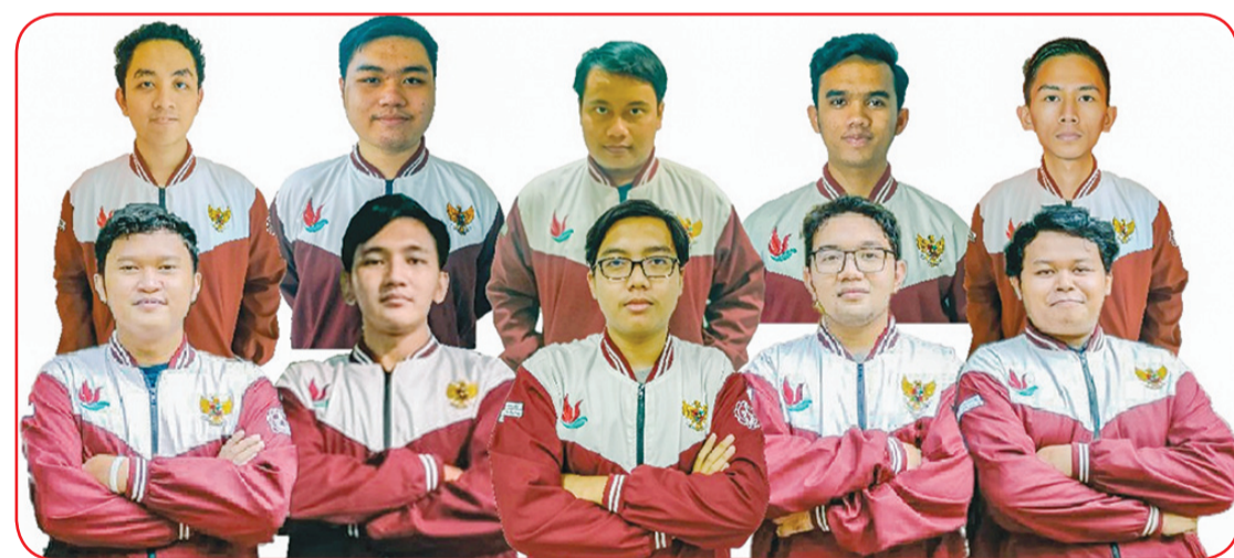
Anggota Tim Nawasena ITS.