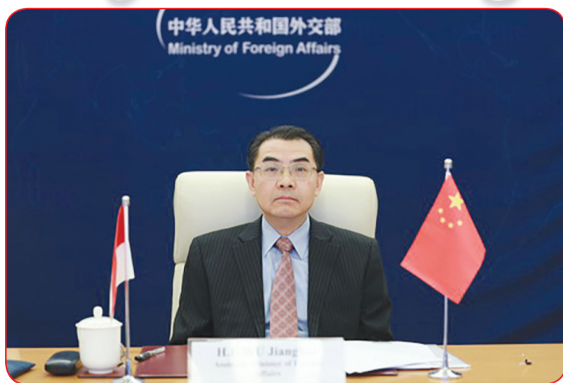
Asisten Menlu Tiongkok Wu Jianghao.

Wu Jianghao menyatakan sejak merebaknya wabah Covid-19, kerja sama anti-epidemi Tiongkok-Indonesia, khususnya kerja sama vaksin terus berada di garis terdepan dunia. Demi membentuk model