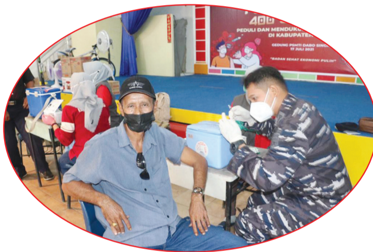
Seorang lansia bersiap menerima vaksin.