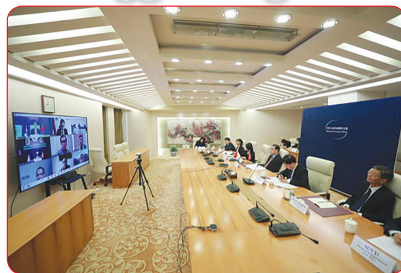
Suasana Dialog Kerja Sama Tingkat Tinggi dengan Indonesia.

Pihak Tiongkok akan terus mendukung pembangunan pusat produksi vaksin regional