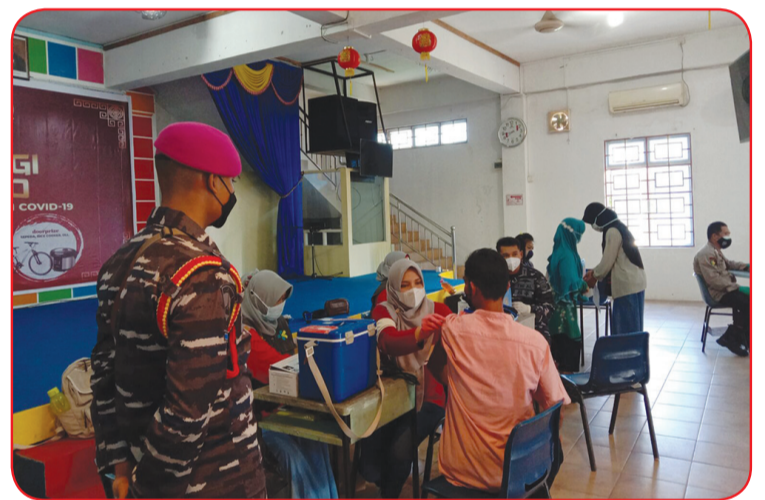
Vaksinasi Massal dan Berbagi Sembako untuk masyarakat yang diselenggarakan TNI Polri dan Pemkab Lingga bersama PSMTI.

LINGGA (IM) - TNI Polri dan Pemkab Lingga bersama PSMTI (Paguyuban Sosial Marga Tionghua Indonesia) Sabtu (17/7) lalu menyelenggarakan Vaksinasi Massal dan Berbagi Sembako untuk masyarakat bertempat di Gedung PSMTI Dabo Singkep.