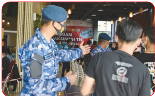
Salah seorang anggota TNI AU mengarahkan calon penerima vaksin Covid-19.