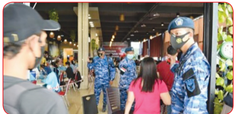
Salah seorang anggota TNI AU mengarahkan calon penerima vaksin Covid-19.