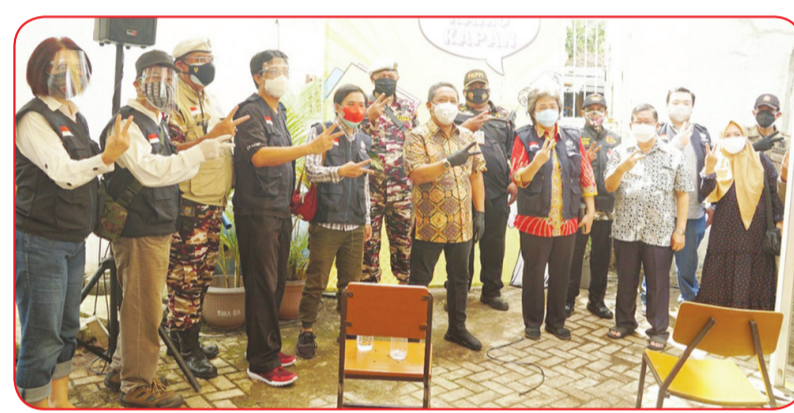
Wakil Walikota Bandung Yana Mulyana (depan keempat dari kanan) berfoto bersama dengan panitia penyelenggara, TNI dan Polri.

Wakil Walikota Yana dalam sambutannya menyatakan bahwa dukungan pihak sekolah dan para rekan alumni ini memberikan dukungan atas kegiatan anti-epidemi Pemkot Bandung.