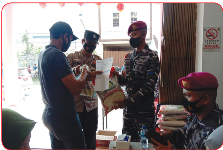
Anggota TNI dan Polri menyerahkan bingkisan sembako kepada masyarakat.