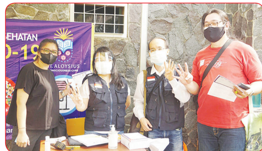
Panitia penyelenggara menyambut hangat alumni angkatan 94 yang akan divaksinasi