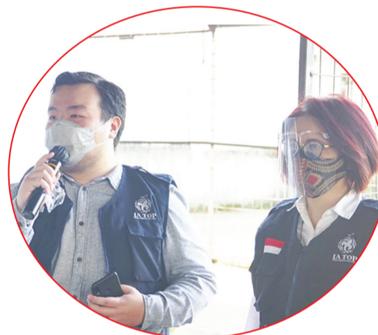
Sambutan Ketua Panitia Penyelenggara.