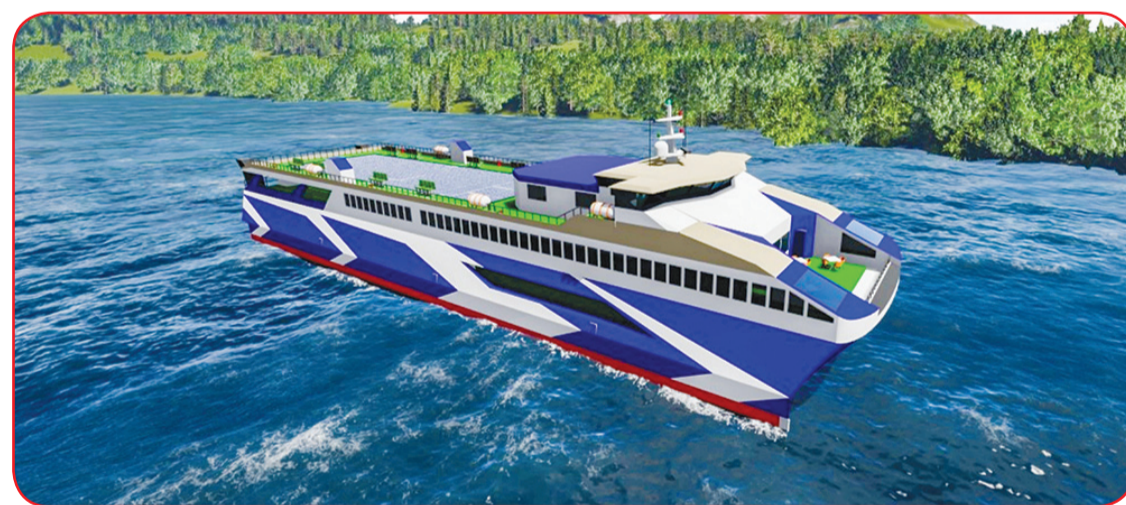
Desain Kapal MV Lanterna karya Tim Nawasena ITS yang menyabet Juara 2 pada International Student Design Competition 2021.

SURABAYA (IM) - Kondisi pandemi Covid-19 tidak menghalangi mahasiswa Institut Teknologi Sepuluh Nopember (ITS) untuk terus berprestasi.